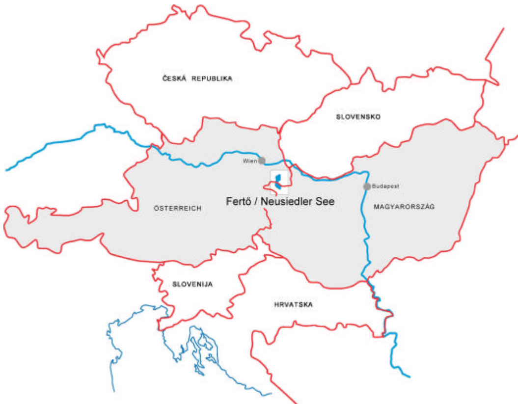
Karte 1: Lage im Raum